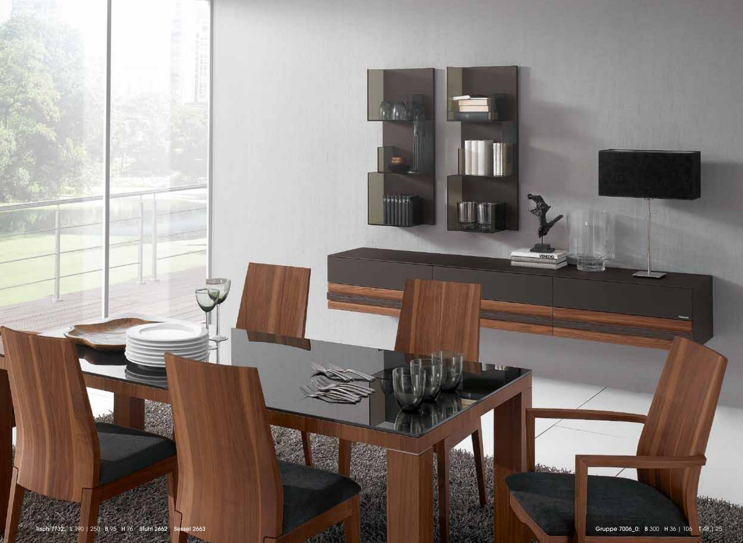
Tisch 7732: L 190 | B 95 | H 76 | Stuhl 2662 | Sessel 2663