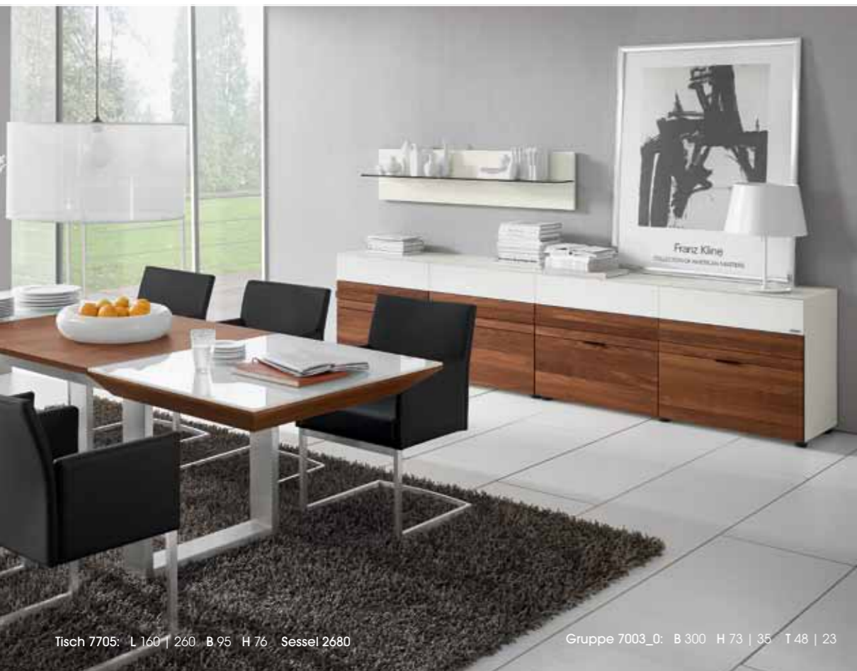
Tisch 7705: L 160 | 260 B 95 H 76 Sessel 2680

Avec « invito », composez vous-même l'ameublement de votre choix. Que ce soit pour les salons ou les salles à manger, avec les tables et les chaises assorties du programme « table & friends », vous obtiendrez toujours une ambiance harmonieuse et équilibrée.