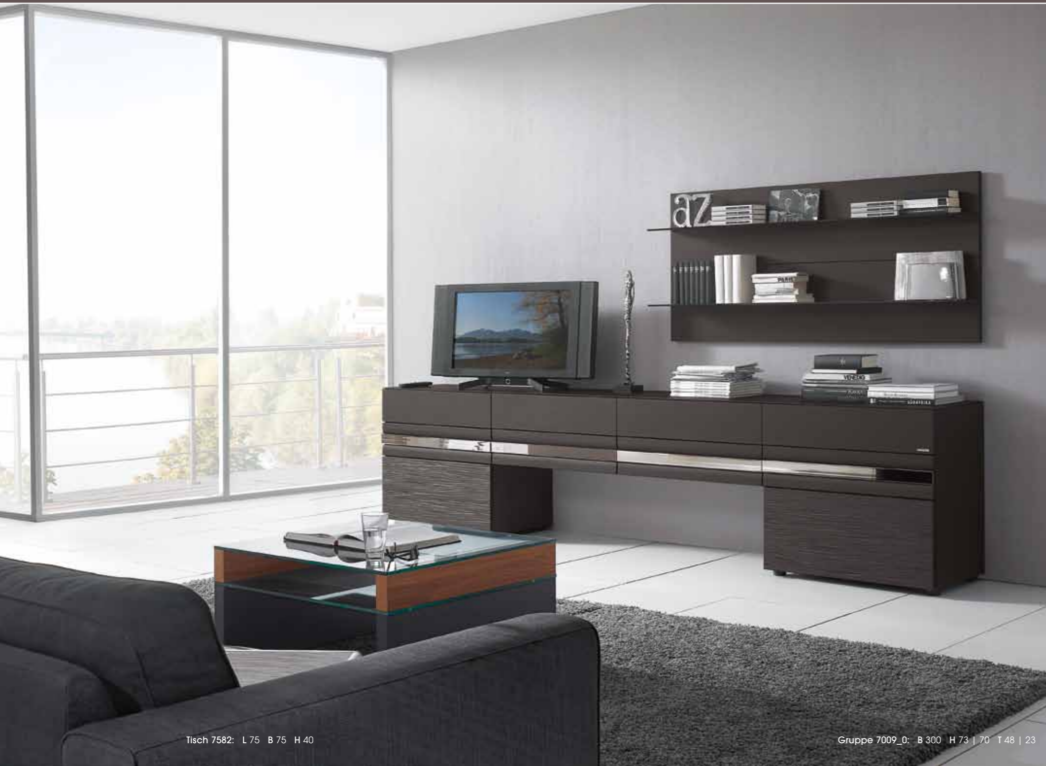
Tisch 7582: L 75 B 75 H 40

invito. glanzvoll arrangieren. invito. arrange exceptionally. invito. arranger en splendeur.