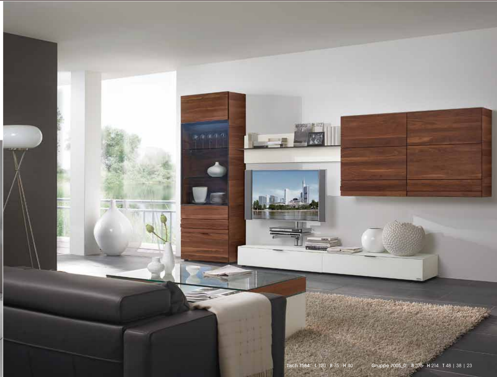
Tisch 7584: L 120 B 75 H 40