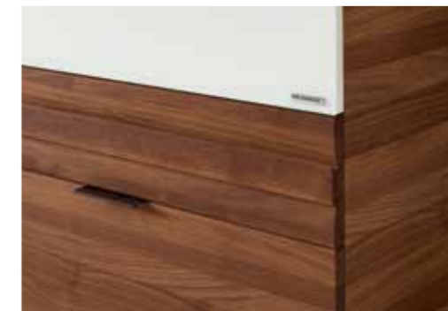
Korpus Nussbaum, Front Nussbaum massiv geölt, Glas Optiwhite satiniert, Griffleiste Nussbaum massiv geölt