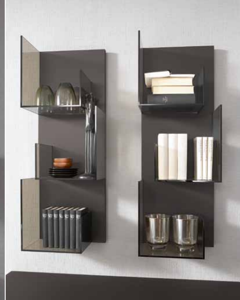
Gruppe 7006_0: B 300 | H 36 | T 48 | 25

Neben dem eigenständigen und harmonischen Design weiß „invito“ auch durch innere Werte zu gefallen. Viele hochwertige und funktionelle Ausstattungsdetails lernt man erst bei der täglichen Nutzung zu schätzen.