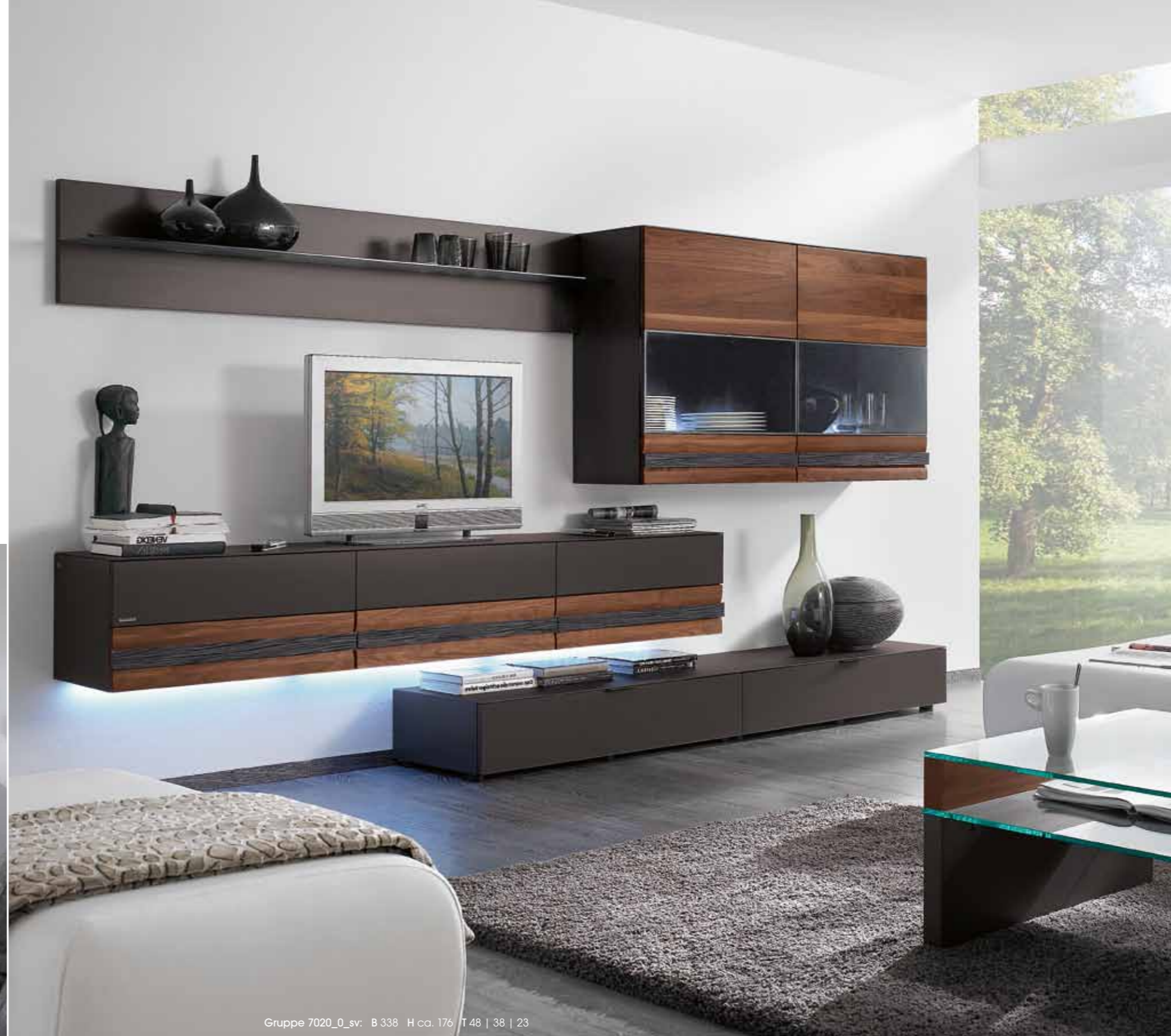
Gruppe 7020_0_sv: B 338 H ca. 176 T 48 | 38 | 23

invito. bewusst leben. invito. live deliberately. invito. vivre consciemment.