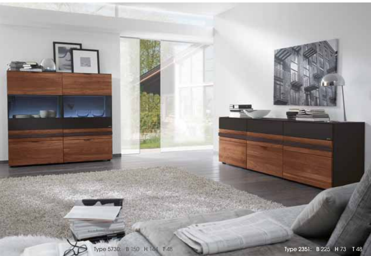
Type 5730: B 150 H 144 T 48

L'agréable teinte havane harmonise aussi à la perfection avec la chaleur du noyer. La barre-poignée à la structure marquante ressort ici avec un effet assuré.