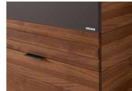
Korpus Nussbaum, Front Nussbaum massiv geölt, Glas Havanna satiniert, Griffleiste Nussbaum massiv geölt