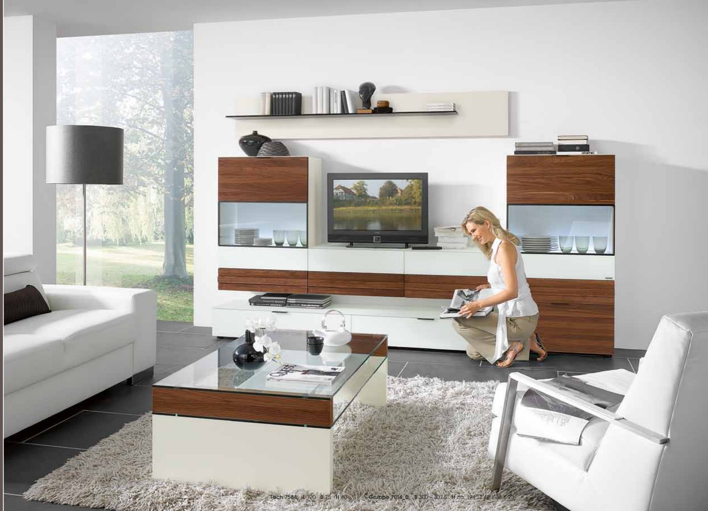
Tisch 7584: L 120 B 75 H 40 Gruppe 7014_0: B 300 - 337,5 H ca. 194 T 48 I 38 I 23

La combinaison du bois de noyer massif pour les façades et du verre satiné blanc clair et froid pour les éléments frontaux et les panneaux de recouvrement crée des contrastes palpitants et concède en même temps une ambiance moderne et confortable.