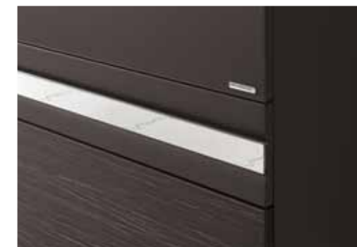
Korpus Lack Havanna, Front Havanna Struktur, Glas Havanna satiniert, Griffleiste Platin Hochglanz