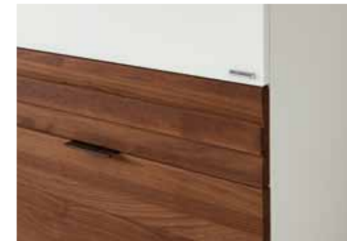
Korpus Lack Polarweiß, Front Nussbaum massiv geölt, Glas Optiwhite satiniert, Griffleiste Nussbaum massiv geölt